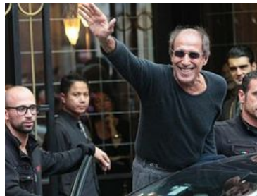
Adriano Celentano esce dall'albergo e saluta i tanti fans che lo aspettavano da ore. Il Molleggiato lascia Verona dopo i due concerti record in Arena