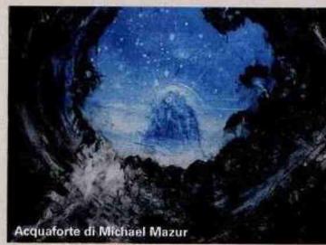
Acquaforte di Michael Mazur

Per il settecentenario della morte di Dante, Verona ha regalato alla città un restauro molto atteso: quello della statua dell'Alighieri in piazza dei Signori, che dovrebbe concludersi a breve. Realizzata da Ugo Zannoni nel 1865, l'opera fu inaugurata all'alba per scongiurare la reazione degli Austriaci. Verona entrò nel Regno d'Italia solo l'anno dopo. Naturalmente l'omaggio al poeta vede protagoniste una serie di mostre, tra cui Tra Dante e Shakespeare. Il mito di Verona , dal 23 aprile al 5 giugno alla Gam-Galleria d'Arte Moderna Achille Forti (cortile Mercato Vecchio, 045/800.19.03; gam.comune.verona.it ). La rassegna affronta due temi: il rapporto tra Dante e la Verona di Cangrande e il revival ottocentesco di un medioevo idealizzato con al centro il mito shakespeariano di Romeo e Giulietta. Al Museo di Castelvecchio (corso Castelvecchio 2, 045/806.26.11; museodicastelvecchio.comune.verona.it ) fino al 3 ottobre si ammira Dante negli archivi. L'Inferno di Mazur , che propone 41 acquaforti che l'artista americano Michael Mazur (1935-2009) realizzò ispirandosi alla prima cantica della Divina Commedia . Di recente il Museo di Castelvecchio si è anche arricchito del grandioso Polittico di San Luca (1470-80), esposto nella sala di Mantegna e Crivelli.