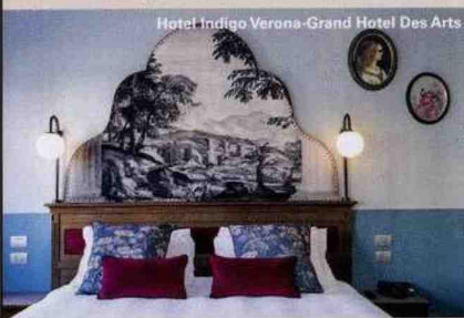
Hotel Indigo Verona-Grand Hotel Des Arts

lat-Ufficio Informazioni e Accoglienza Turistica di Verona, via degli Alpini 9-piazza Bra, 045/806.86.80, visitverona.net