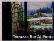
Terrazza Bar Al Ponte