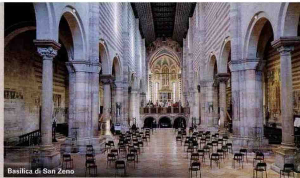
Basilica di San Zeno

A Verona Dante soggiorna a lungo, nel 1303-04 e poi dal 1316, prima sotto la protezione di Bartolomeo e poi di Cangrande della Scala. La città che Dante vede è ancora quella medievale, ricca però di nuovi cantieri. In occasione dei settecento anni dalla sua morte si può percorrere un tour tra i monumenti evocati da Dante nella Divina Commedia o da lui frequentati. Tra questi la chiesa di Sant'Elena (piazza Duomo 21, 045/29.28.13), attigua alla cattedrale, dove l'Alighieri nel 1320 tenne una lezione, come recita una targa che ricorda l'evento. Orario: 8-13 e 15-19. Di certo non vide le Arce Scaligere (via Santa Maria Antica), erette nella seconda metà del '300, ma una visita al monumento funebre dei Della Scala è imprescindibile, anche solo per vedere l'aquila («santo uccello») e la scala, scolpite sul sarcofago di Bartolomeo, dettagli citati da Dante