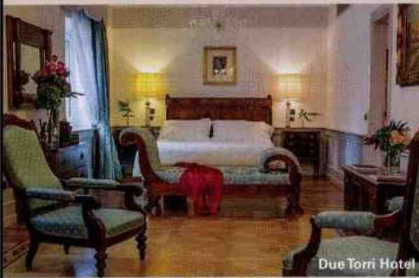
Due Torri Hotel