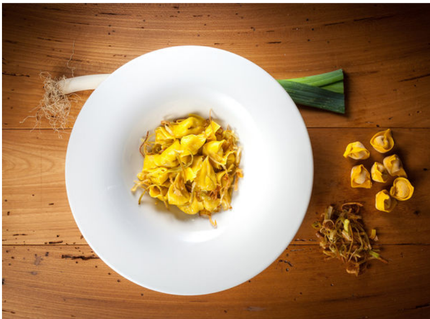
Osteria Numero Uno

Если коктейли вам ближе вина, ищите спикизи-бар The Soda Jerk рядом с мостом Ponte Nuovo или переполненный, шумный Archivio на via Rosa – тут половина публики оккупирует улицу, за неимением места внутри, а коктейли называются, среди прочих, Odessa Beach, Brexit и Mexican Cartel. Только они и могут служить оправданием, если потом вы все-таки пойдете к дому Джульетты трогать вышеозначенную Джульетту за бронзовую грудь.